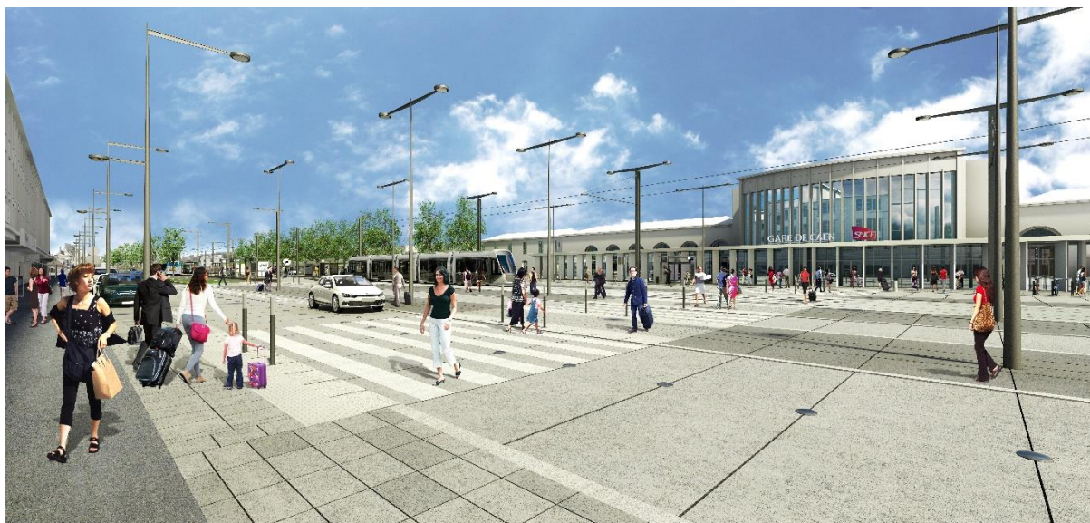
La perspective d'aménagement futur place de la Gare à Caen.