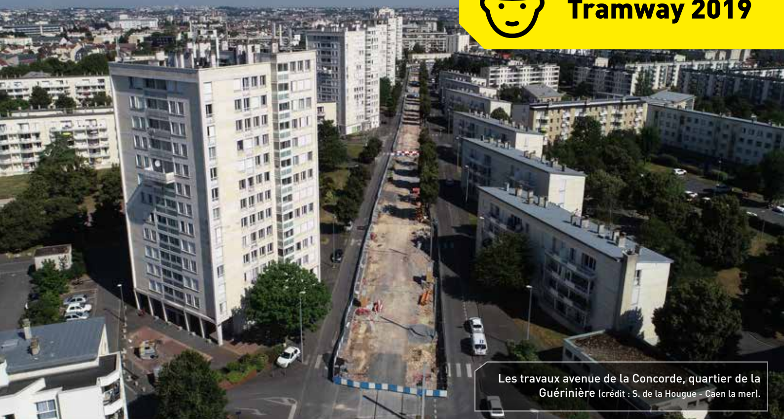
Les travaux avenue de la Concorde, quartier de la Guérinière.

En septembre 2019, un nouveau tramway circulera sur le territoire de la Communauté urbaine Caen la mer.