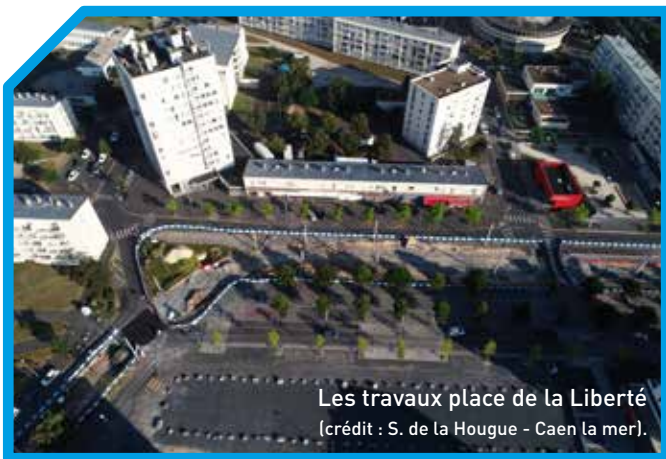
Les travaux place de la Liberté (crédit : S. de la Hougue - Caen la mer).

CAEN - GARE SNCF Le dépose-minute et la station de taxis de la place de la Gare sont reportés côté Rives de l'Orne durant les travaux. Les commerces sont accessibles.